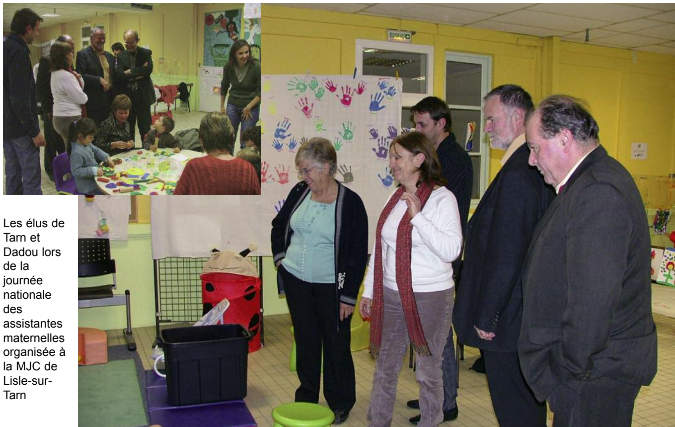
Les élus de Tarn et Dadou lors de la journée nationale des assistantes maternelles organisée à la MJC de Lisle-sur-Tarn